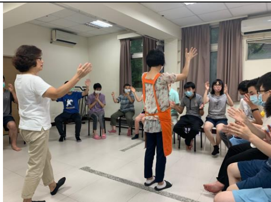
音樂療育課程-透過音樂與節奏遊戲進行課程活動