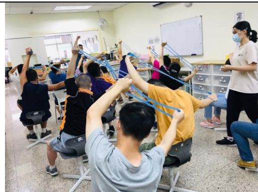
體適能課程-活力環