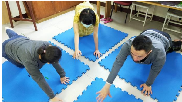
體適能課程-訓練身體穩定度