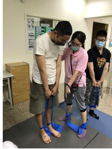
物理治療課程-治療師針對個別學員進行動作的指導與調整