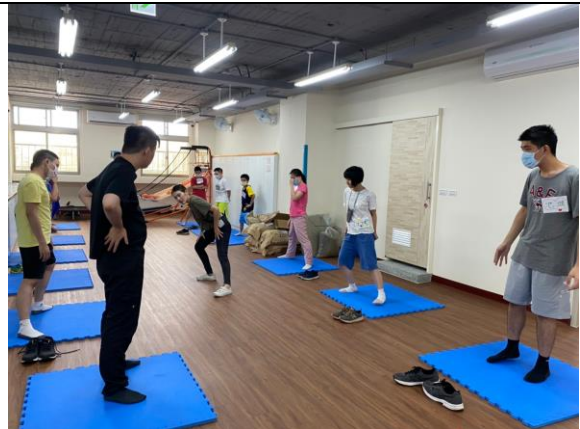
體適能課程-伸展活動